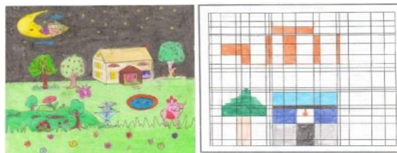
۴- نمونه تکمیل شده صفحه شطرنجی ۵- نمونه تکمیل شده نقاشی آزاد