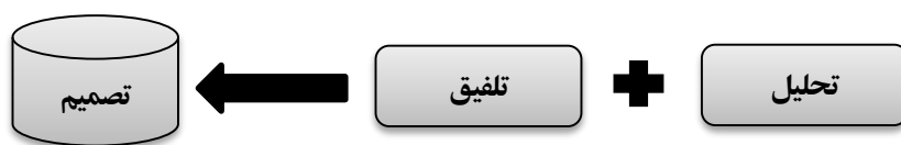
شکل ۱. فرایند تصمیم‌گیری

با توجه به آن چه گفته شد، رضایت شغلی سالمندان در پی انتخاب درست و مناسب حاصل می‌شود. در این پژوهش به بررسی کیفی عوامل رضایتمندی و یا عدم رضایتمندی شغلی سالمند با توجه به الگوی چندمحوری شفیع آبادی از طریق مصاحبه با رویکرد روایت درمانی در بستر فرهنگی ایرانی و اسلامی می‌پردازیم. بنابراین سوال اصلی این پژوهش این است که عوامل رضایت و یا عدم رضایت شغلی سالمند با توجه به تجربه زیسته دوران شغلی طی شده کدامند؟ در ضمن این تحقیق مساله ترتیب اولویت‌های سالمند برای انتخاب شغل نیز مورد تحلیل واقع می‌شود و محورهای الگوی شفیع آبادی در فرهنگ ایرانی اسلامی بیان، تقدم و تاخر جدیدی پیدا می‌کنند.